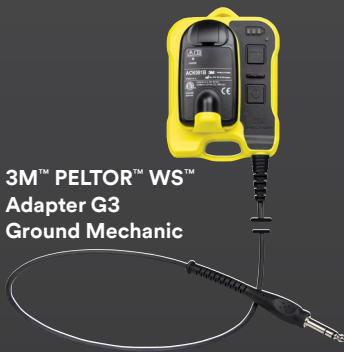
3M™ PELTOR™ WS™ Adapter G3 Ground Mechanic