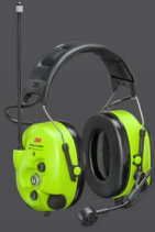
3M™ PELTOR™ WS™ LiteCom Pro III Headset