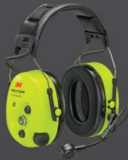
3M™ PELTOR™ WS™ ProTac™ XPI Headset