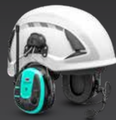
WS™ ALERT™ XP+ Helmbefestigung