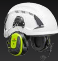
WS™ ALERT™ X Helmbefestigung