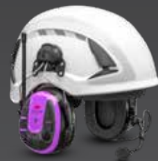
WS™ ALERT™ XPI+ Helmbefestigung