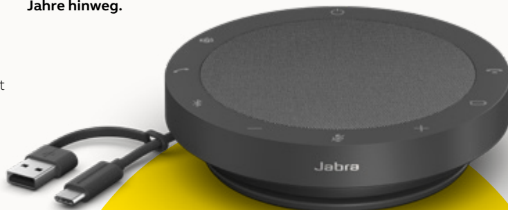
MS TEAMS- UND UC-VARIANTEN

Wir berücksichtigen den Aspekt der Nachhaltigkeit in jeder Phase der Produktentwicklung. Deshalb haben wir das Gehäuse der Speak2 55 aus über 50 % nachhaltigen Materialien** gefertigt und eine Reihe von Bauteilen integriert, die repariert oder ersetzt werden können. Mehr Nachhaltigkeit bedeutet eine längere Lebensdauer deiner Freisprechlösung – und sorgt für Gespräche in hoher Sprachqualität für dich und dein Team über Jahre hinweg.