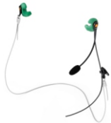
Phonak Serenity SPC