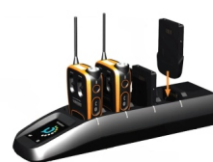
Ladeschale für Funkgerät