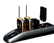
Ladeschale für Funkgerät