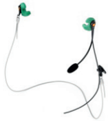
Phonak Serenity SPC