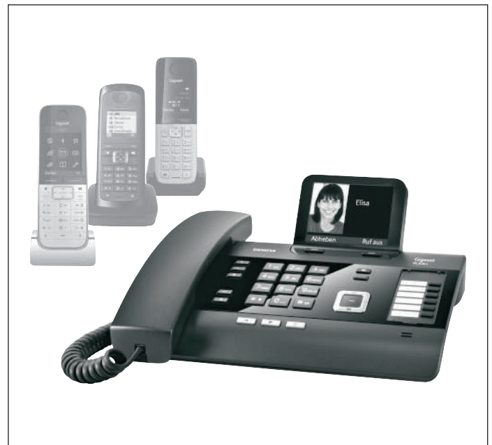
Mobilteile nicht im Lieferumfang enthalten