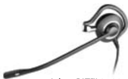
Jabra BIZ™ 2400 Mono, NC mit Ohrbügel

Autorisierter Jabra Vertriebspartner (Deutschland, Österreich, Schweiz):