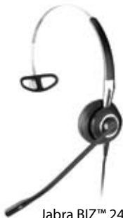
Jabra BIZ™ 2400 Mono, NC mit Überkopfbügel

Die Jabra BIZ™ 2400 Narrowband Varianten sind mit Mono- und Duo-Kopfhörer erhältlich. Bei der 3-in-1 Mono Variante kann zwischen drei verschiedenen Tragestilen individuell bequemste ausgewählt werden. Je nach Geräuschpegel kann zwischen einem Ultra Noise-Cancelling, einem Noise-Cancelling und einem omnidirektionalen Standard Mikrofon gewählt werden.