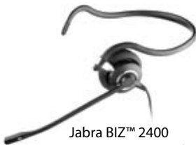
Jabra BIZ™ 2400 Mono, NC mit Nackenbügel