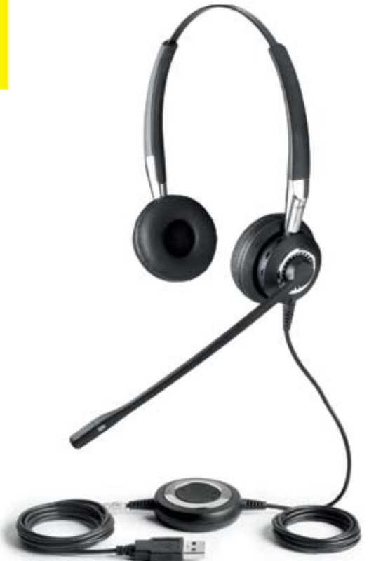
Jabra BIZ™ 2400 USB