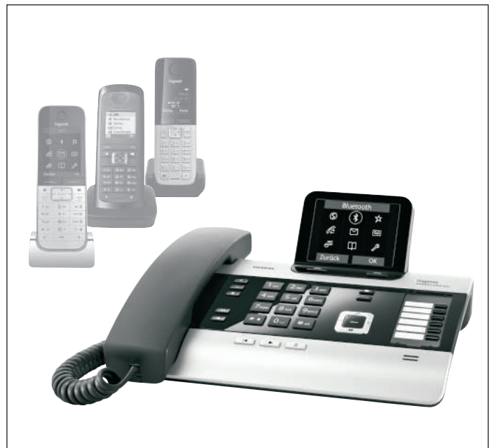
Mobilteile nicht im Lieferumfang enthalten