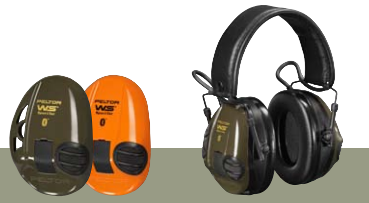
Austauschbare Kapselschalen. Die verschiedenen Farben verbessern die Sicherheit und erhöhen die Sichtbarkeit des Trägers.