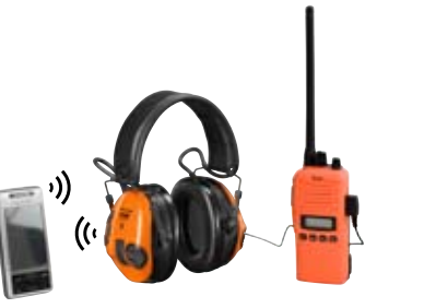
Doppelanschluss – mit und ohne Kabel – möglich.