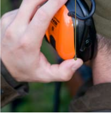
Bluetooth™ ermöglicht eine schnelle Verständigung, ohne zu stören. Mit der praktisch angebrachten PTT/Antworttaste auf der linken Muschel können Sie sich mühelos über Funk verständigen oder Handyanrufe annehmen oder abweisen

Immer in Kontakt Eine klare und zuverlässige Verständigung mit anderen Jagdteilnehmern und mit Wildhütern ist optimal, um die Sicherheit zu fördern und zum Beispiel sicherzustellen, dass Vorschriften eingehalten werden. Der Peltor™ WS SportTac™ lässt sich mithilfe eines großen Zubehörangebots problemlos an verschiedene Funkgeräte anschließen. Dank eingebauter Bluetooth™-Technik ist jetzt auch ein völlig schnurloser Anschluss an Mobiltelefon oder andere Kommunikationsgeräte per Bluetooth™ möglich. Die Telefone können in der Tasche auf stumm geschaltet werden und nur Sie bekommen mit, wenn ein Anruf eingeht. Sie können Bluetooth™ aber auch nutzen, um per MP3-Player oder Handy Musik zu hören, wenn es auf dem Posten zu langweilig wird.